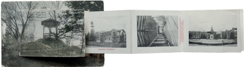
Поштова листівка, яку написав Іван Франко до дочки Анни. Титульна сторона. Ліпик, 1908 р. З фондів ЛМІФ