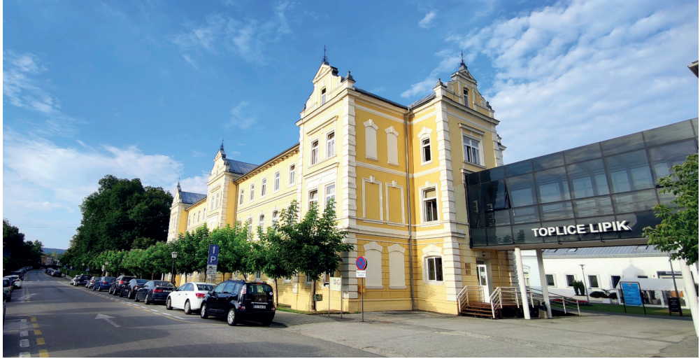
Санаторій, в якому лікувався Іван Франко у Ліпіку. Сучасний вигляд.