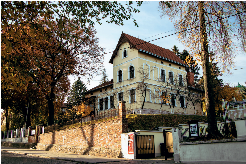
Дім Франка. Осінь 2021 р.