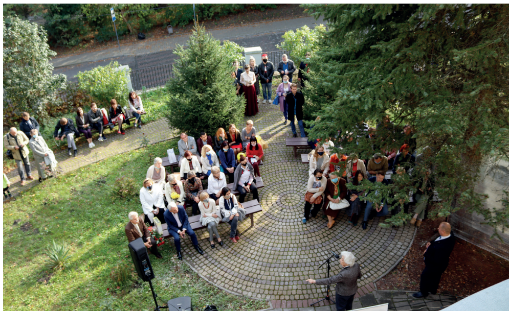
Святкування 80-річчя Дому Франка. Львів, 10 жовтня 2021 р.