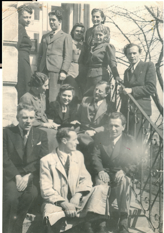
Перші працівники музею Івана Франка у Львові. 1941 р. З фондів ЛМІФ