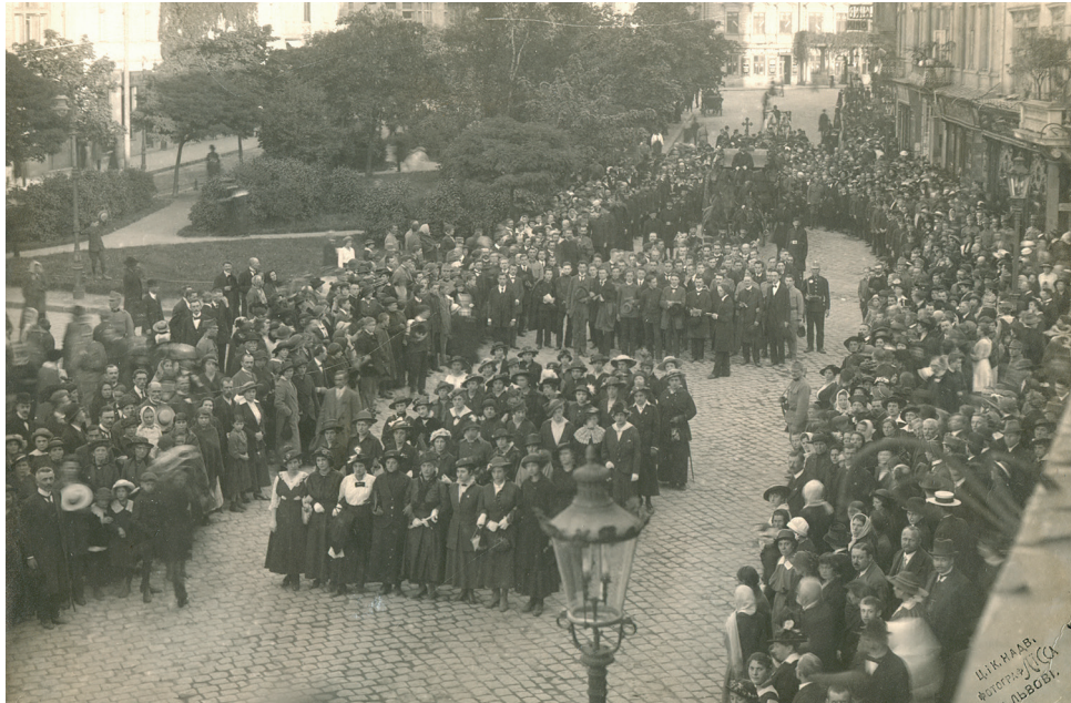
Похорон Івана Франка. Львів, 31 травня 1916 р. З фондів ЛМІФ