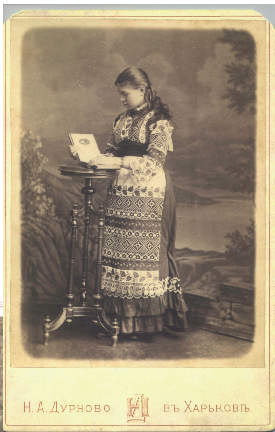
Ольга Хоружинська. Харків, початок 1880-х років.