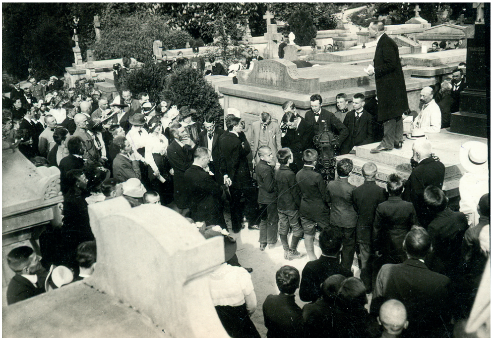
Промова на могилі Івана Франка під час першої річниці його смерті. Львів, 1917 р. З фондів ЛМІФ