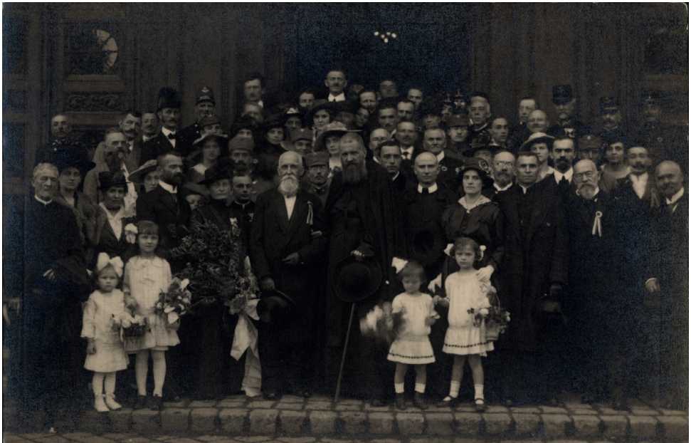
Митрополит Андрей Шептицький після повернення із заслання. 1917 р.