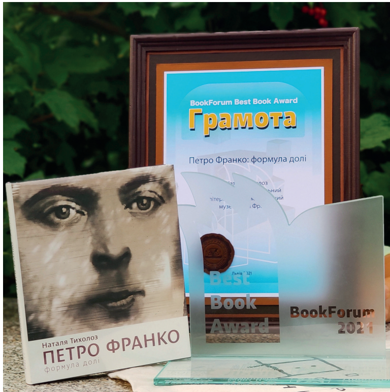
Монографія Наталії Тихолоз «Петро Франко: Формула долі (Життєпис на тлі доби)» здобула нагороду від BookForum у номінації «Наукова література» 2021 р.