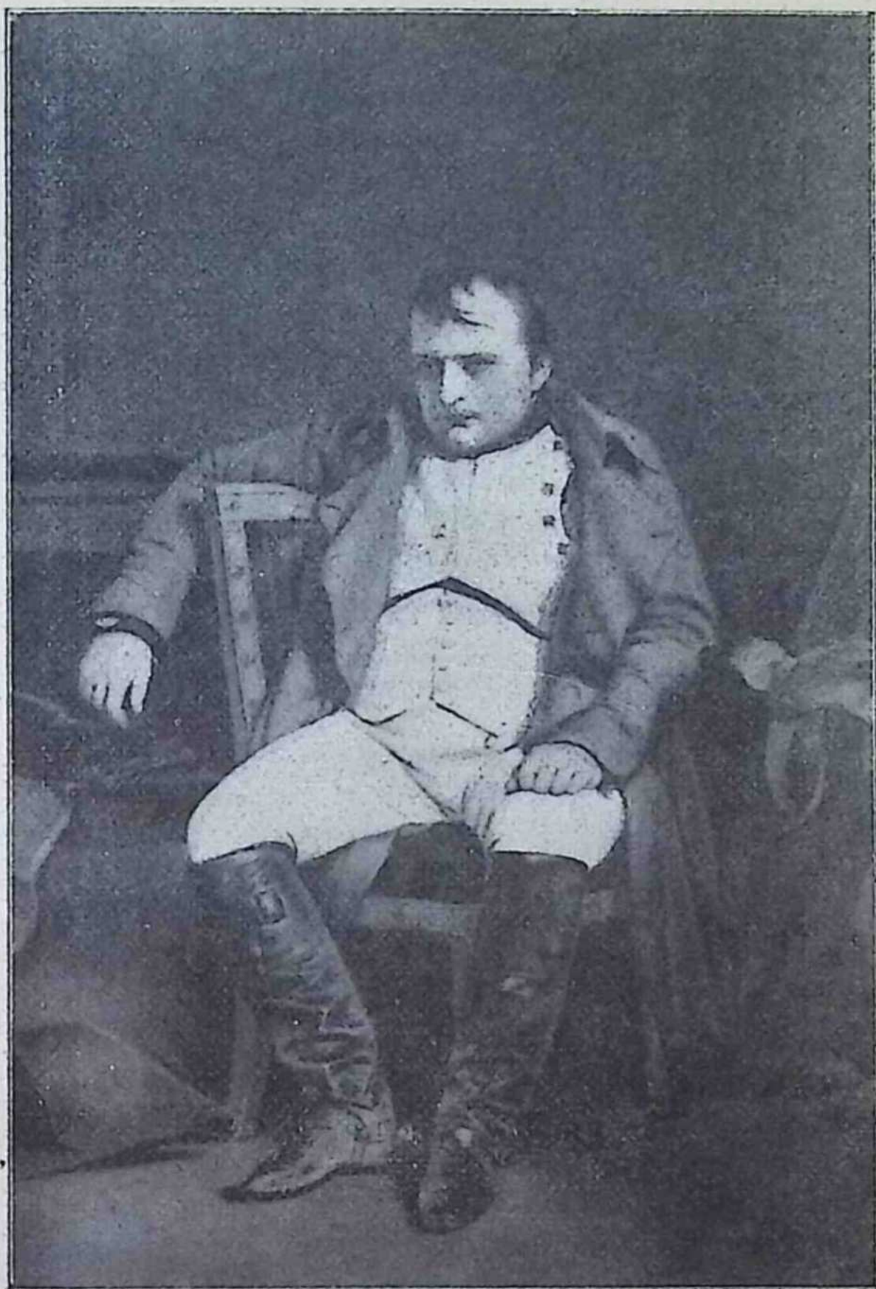
Наполеон I. цїсар Франції від р. 1804—1815.